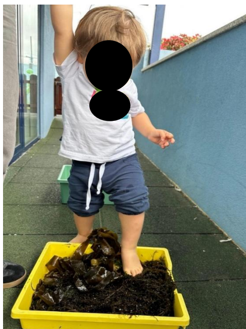
Imagem 6 - Exploração sensorial

A criança EB “reagiu de forma positiva ao percurso e mostrou prazer na exploração sensorial”, mantendo-se interessado e confortável durante a atividade, o que se torna perceptível na postura de participação registada na Imagem 6 (Exploração sensorial).