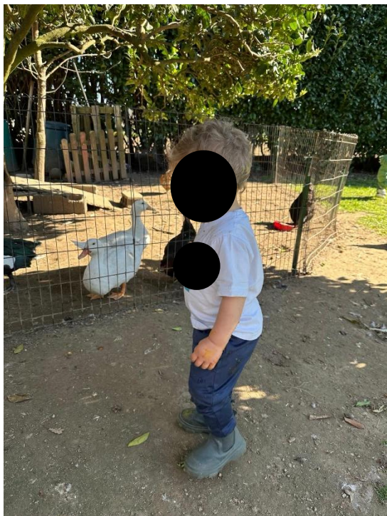
Imagem 23 - Alimentar os animais

Um aspeto distintivo desta experiência foi o contacto com os animais, que acrescentou valor educativo e afetivo ao contexto. Os registos fotográficos documentam momentos de “Alimentar os animais” e “Contacto com os animais” (Imagens 23 e 24), que tendem a mobilizar atenção, cuidado e respeito pelo outro, ao mesmo tempo que aproximam as crianças de rotinas e responsabilidades simples (observar, aproximar-se, alimentar, aguardar e repetir).