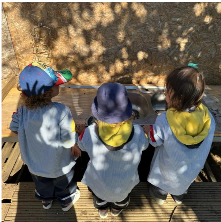
Imagem 20 - Cozinha de lama

A Atividade 5 decorreu numa quinta externa ao colégio, permitindo às crianças um contacto prolongado com o ar livre, com elementos naturais (lama, terra, recipientes, materiais soltos) e ainda com animais, que puderam observar e alimentar. A experiência articulou, de forma particularmente clara, os objetivos do estudo: por um lado, tornou visíveis benefícios emocionais (incluindo autorregulação), sociais e cognitivos associados à interação com a natureza; por outro, evidenciou o impacto de metodologias vivenciais (exploração, brincadeira heurística e ação direta) e o papel do educador na criação de um ambiente seguro, estimulante e aberto à iniciativa da criança. O início da experiência e o enquadramento do espaço de exploração podem ser visualizados na Imagem 20 (Cozinha de lama), que ajuda a compreender o tipo de materiais disponibilizados e a natureza aberta da atividade.