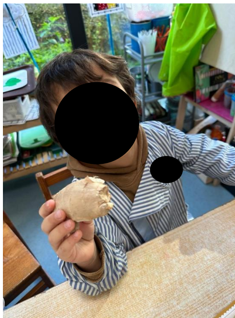
Imagem 35 - Registo

No plano social, a atividade criou oportunidades para partilha de materiais e respeito pelo momento do outro. Isso é visível em GR, que “partilhou e esperou a vez”, evidenciando cooperação e participação ajustada ao grupo. Também SP “interagiu e partilhou materiais”, o que sugere envolvimento com os pares e comunicação durante a exploração. A natureza coletiva da proposta (circulação de frascos/cheiros, comentários partilhados) favorece este tipo de interação, desde que o adulto organize turnos e apoie a partilha, tal como se verifica na situação registada na Imagem 35 (Registo).