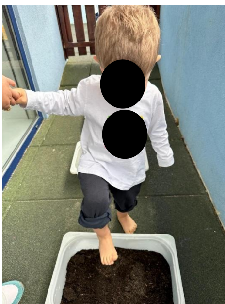
Imagem 7 - Exploração sensorial

No plano cognitivo, destacou-se a curiosidade e a exploração intencional dos materiais. A criança SP “demonstrou curiosidade e fez perguntas sobre os materiais do percurso”, enquanto DF “observou os detalhes do percurso e explorou com atenção as diferenças entre as texturas”, e manteve-se concentrado no que estava a fazer, ilustrando uma exploração mais cuidada e intencional, visível na Imagem 7 (Exploração sensorial).