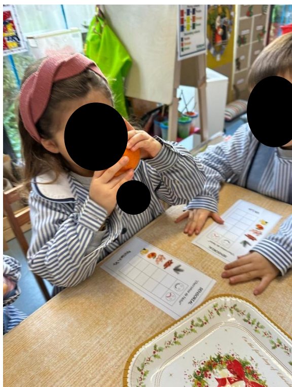
Imagem 33 - Exploração de aromas

Ao nível emocional, a atividade revelou envolvimento positivo e disponibilidade para explorar. A criança EB “mostrou entusiasmo na atividade”, o que indica expressão de emoções positivas perante o desafio sensorial. Também DP “explorou com interesse e calma”, sugerindo tranquilidade durante a experiência e uma atitude serena perante os estímulos. Estes exemplos mostram que propostas sensoriais com aromas podem favorecer bem-estar e participação, sobretudo quando organizadas de forma segura, permitindo que a criança se aproxime ao seu ritmo. Um momento de aproximação e exploração olfativa é visível na Imagem 33 (Exploração de aromas).