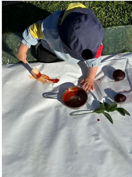
Imagem 1 - Pintura com alimentos

benefícios emocionais (incluindo autorregulação), sociais e cognitivos do contacto com a natureza, articulando-se com os objetivos da investigação: identificar benefícios da interação com a natureza, analisar estratégias/metodologias centradas na ligação ao meio e compreender o papel do adulto na criação de ambientes naturais de aprendizagem. O enquadramento geral da proposta e o tipo de exploração associado à pintura estão registados na Imagem 1 (Pintura com alimentos), que ajuda a visualizar a natureza prática e sensorial da experiência.