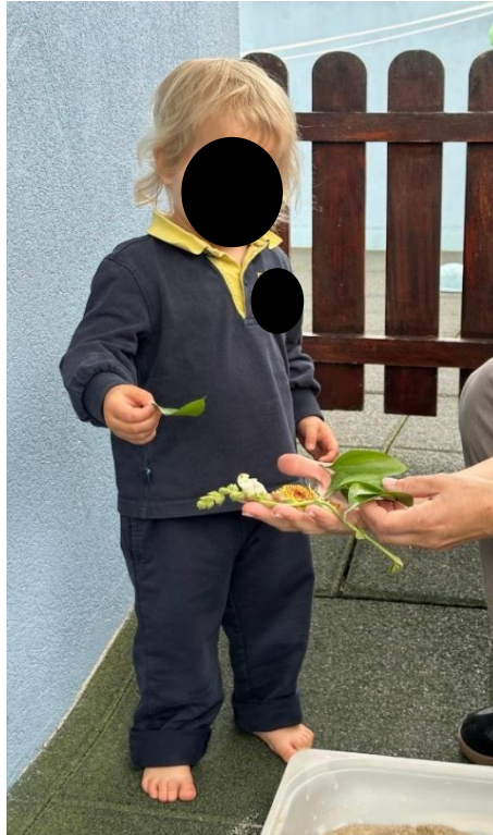
Imagem 5 - Exploração sensorial

para tocar e experimentar os materiais, comportamento que se evidencia na Imagem 5 (Exploração sensorial).