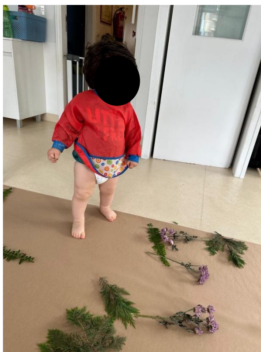
Imagem 9 - Exploração dos materiais

A Atividade 3 consistiu numa proposta de pintura com plantas, em contexto exterior, recorrendo a elementos naturais (plantas, texturas e marcas) como materiais de exploração e criação. Esta atividade permitiu observar, de forma articulada, benefícios emocionais e comportamentais (autorregulação), sociais e cognitivos decorrentes da ligação da criança ao meio natural, ao mesmo tempo que evidencia o valor de metodologias assentes na experiência direta, na curiosidade e na autonomia. Na Imagem 9 podemos observar a Exploração dos materiais.