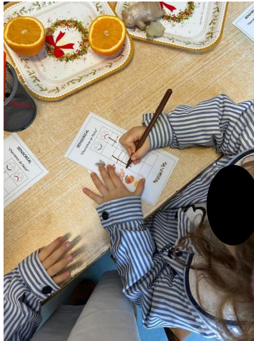
Imagem 34 - Registo