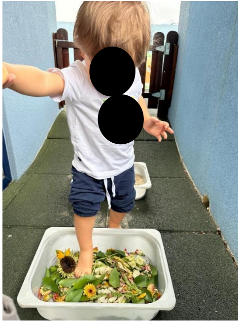
Imagem 8 - Exploração sensorial

Relativamente à dimensão social, observou-se aproximação e interação entre pares durante a atividade. PS “procurou aproximar-se dos colegas durante a exploração” e uma das crianças identificadas como MA “interagiu com os colegas enquanto experimentava os materiais”. Em paralelo, MN “precisou de apoio para se manter próximo do grupo e partilhar o espaço”, mostrando que, apesar do potencial agregador destas atividades, algumas crianças necessitam de mediação do adulto para integrar a experiência em contexto de grupo.