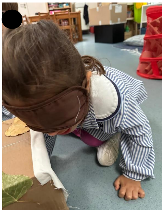
Imagem 29 - Exploração sensorial de Outono

Ao nível emocional, a atividade favoreceu envolvimento e interesse na exploração. Observa-se, por exemplo, que EB “participou com entusiasmo”, sugerindo expressão de emoções positivas e motivação para se envolver com os materiais. Também PM “mostrou interesse e manteve-se tranquila”, o que aponta para um clima de segurança e bem-estar durante a proposta. Estes registos são consistentes com a ideia de que materiais naturais e propostas de descoberta tendem a promover participação positiva, sobretudo quando a atividade é apresentada de forma acessível e com tempo para explorar. A forma como as crianças se aproximaram dos materiais e se envolveram na dinâmica é perceptível na Imagem 29 (Exploração sensorial de Outono).