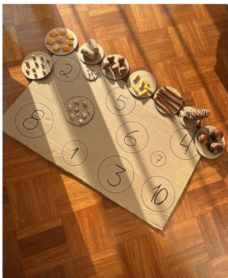
Imagem 30 - Jogo de associação

A Atividade 8, “Jogo de associação”, consistiu numa proposta estruturada em que as crianças foram desafiadas a relacionar elementos, fazer correspondências e tomar decisões durante o jogo. Esta atividade, apesar de não ocorrer num espaço natural, permitiu observar indicadores relevantes ligados ao desenvolvimento emocional e comportamental (autorregulação), social e cognitivo, mostrando como estratégias pedagógicas com regras simples e objetivos claros podem potenciar a atenção, a persistência e a interação em grupo. A organização do material e a forma como o jogo foi apresentado ao grupo podem ser observadas na Imagem 30 (Jogo de associação), que ajuda a compreender a estrutura e as regras implícitas da atividade.