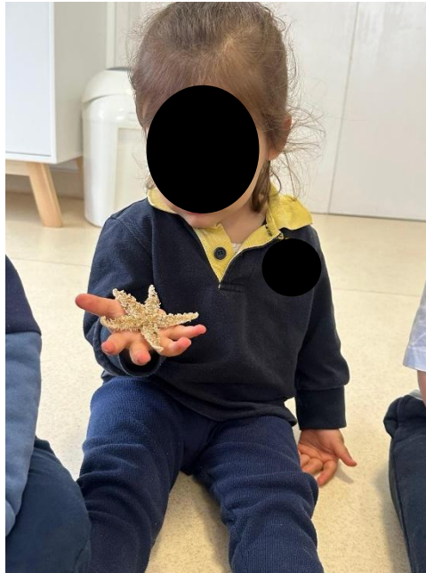
Imagem 17 - Exploração Estrela do Mar

Do ponto de vista social, surgiram momentos de participação partilhada e interação, sobretudo em crianças que se envolveram de forma mais expressiva com os materiais. Uma das crianças identificadas como MA “interagiu bem com os colegas durante a atividade”, e DF manteve-se envolvido, ainda que tenha precisado de “apoio pontual na partilha”, o que ilustra a necessidade de mediação para assegurar turnos e uso equilibrado dos recursos. A dinâmica de exploração em contexto de grupo pode ser reconhecida na Imagem 18 (Exposição elementos do mar), onde se observa a proximidade entre crianças e materiais no mesmo espaço.