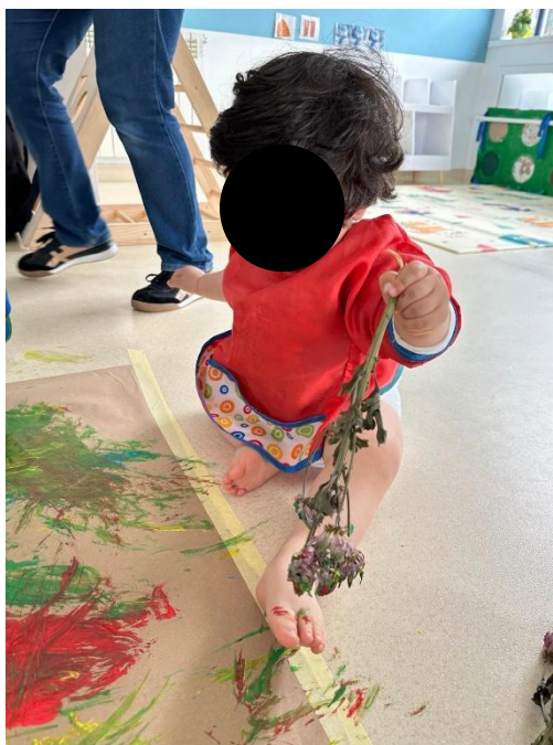
Imagem 12 - Pintura com plantas

Do ponto de vista social, observaram-se momentos de partilha e interação durante a utilização dos materiais. Uma das crianças identificadas como MA “participou com boa interação com os colegas, partilhando materiais e mantendo o envolvimento”, o que evidencia cooperação e participação em grupo. Numa atividade com materiais comuns e espaço partilhado, este tipo de interação ganha particular relevância, porque a organização do ambiente (materiais acessíveis, espaço para circular e experimentar) facilita a comunicação e a colaboração entre pares, (imagem 12: Pintura com plantas).