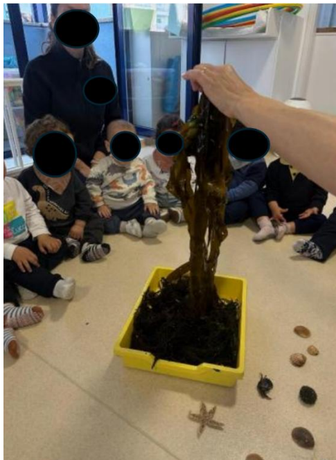
Imagem 18 - Exposição elementos do mar

Do ponto de vista social, surgiram momentos de participação partilhada e interação, sobretudo em crianças que se envolveram de forma mais expressiva com os materiais. Uma das crianças identificadas como MA “interagiu bem com os colegas durante a atividade”, e DF manteve-se envolvido, ainda que tenha precisado de “apoio pontual na partilha”, o que ilustra a necessidade de mediação para assegurar turnos e uso equilibrado dos recursos. A dinâmica de exploração em contexto de grupo pode ser reconhecida na Imagem 18 (Exposição elementos do mar), onde se observa a proximidade entre crianças e materiais no mesmo espaço.