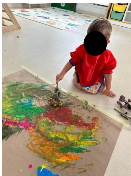
Imagem 14 - Pintura com plantas

Em termos de estratégia pedagógica, esta proposta confirma o papel do educador na criação de um ambiente natural de aprendizagem: ao disponibilizar materiais naturais diversificados e ao permitir exploração com margem para escolha, o adulto favorece uma participação diferenciada, respeitando ritmos individuais. Isto é visível em crianças que precisaram de encorajamento para experimentar novas formas de pintar (como AC) e noutras que se mostraram mais proativas e exploratórias, querendo experimentar várias técnicas e materiais. A atividade, assim, integra objetivos de investigação de forma coerente: evidencia benefícios do contacto com a natureza, demonstra a pertinência de metodologias vivenciais e sublinha a importância da mediação do educador na construção de experiências significativas no exterior, imagem 14: Pintura com plantas.