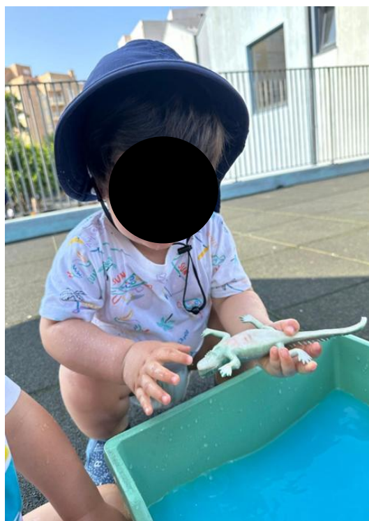
Imagem 25 - À descoberta dos animais

A Atividade 6, “À procura dos animais”, consistiu numa exploração em que as crianças procuraram animais num recipiente com água, farinha e corante, criando um contexto sensorial e de descoberta que promoveu contacto direto com materiais, curiosidade e experimentação. Esta proposta permite analisar, de forma integrada, os benefícios emocionais (incluindo autorregulação), sociais e cognitivos decorrentes da ligação da criança ao meio, bem como refletir sobre a metodologia adotada (exploração ativa e aprendizagem pela experiência) e o papel do educador na criação de um ambiente seguro e estimulante. O enquadramento geral da atividade e o material utilizado podem ser observados na Imagem 25 (À descoberta dos animais), que ajuda a compreender a organização do contexto de exploração.