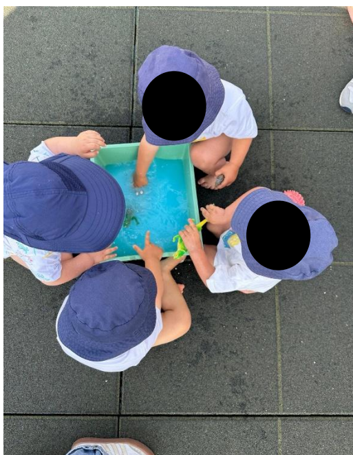
Imagem 26 - À descoberta dos animais