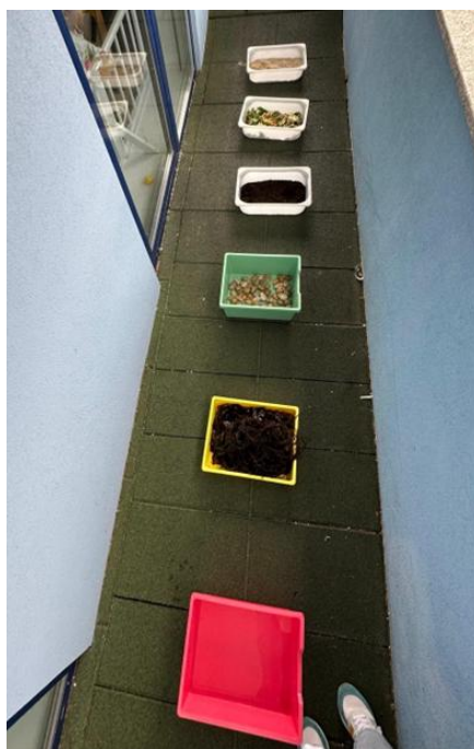
Imagem 4 - Percurso Sensorial

A Atividade 2 consistiu num percurso sensorial com materiais naturais, realizado no exterior da instituição cooperante. A organização do percurso, com uma sequência clara de estações e diferentes texturas a explorar, é visível na Imagem 4 (Percurso Sensorial), ajudando a compreender a estrutura que sustentou a experiência.