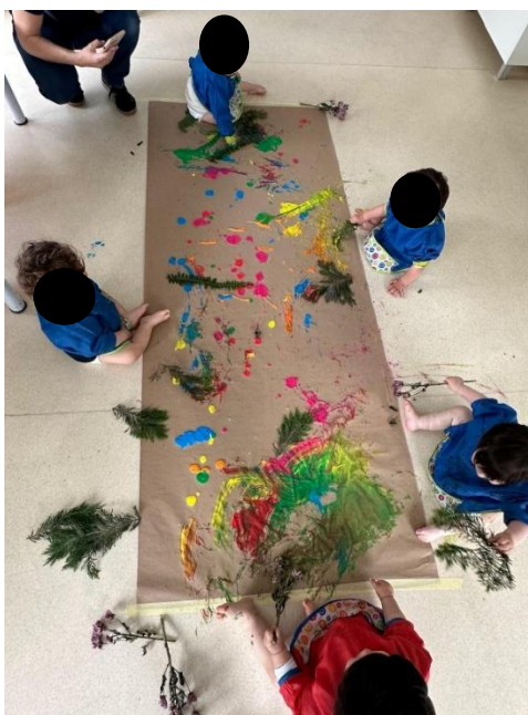
Imagem 13 - Pintura com plantas

Em termos de estratégia pedagógica, esta proposta confirma o papel do educador na criação de um ambiente natural de aprendizagem: ao disponibilizar materiais naturais diversificados e ao permitir exploração com margem para escolha, o adulto favorece uma participação diferenciada, respeitando ritmos individuais. Isto é visível em crianças que precisaram de encorajamento para experimentar novas formas de pintar (como AC) e noutras que se mostraram mais proativas e exploratórias, querendo experimentar várias técnicas e materiais. A atividade, assim, integra objetivos de investigação de forma coerente: evidencia benefícios do contacto com a natureza, demonstra a pertinência de metodologias vivenciais e sublinha a importância da mediação do educador na construção de experiências significativas no exterior, imagem 14: Pintura com plantas.