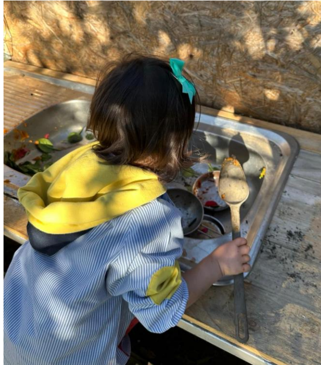
Imagem 22 - Cozinha de lama

No plano social, a cozinha de lama funcionou como uma situação naturalmente colaborativa, onde a partilha de materiais e o uso do espaço comum exigem negociação e comunicação. JG “interagiu com os colegas (...) e manteve-se entusiasmado durante a brincadeira” e uma das crianças identificadas como MA “envolveu-se na brincadeira e interagiu bem com os colegas ao preparar as misturas”. Por sua vez, GA participou “mantendo-se envolvida e disponível para colaborar”, reforçando a ideia de que estes contextos favorecem a participação em grupo e a cooperação espontânea.