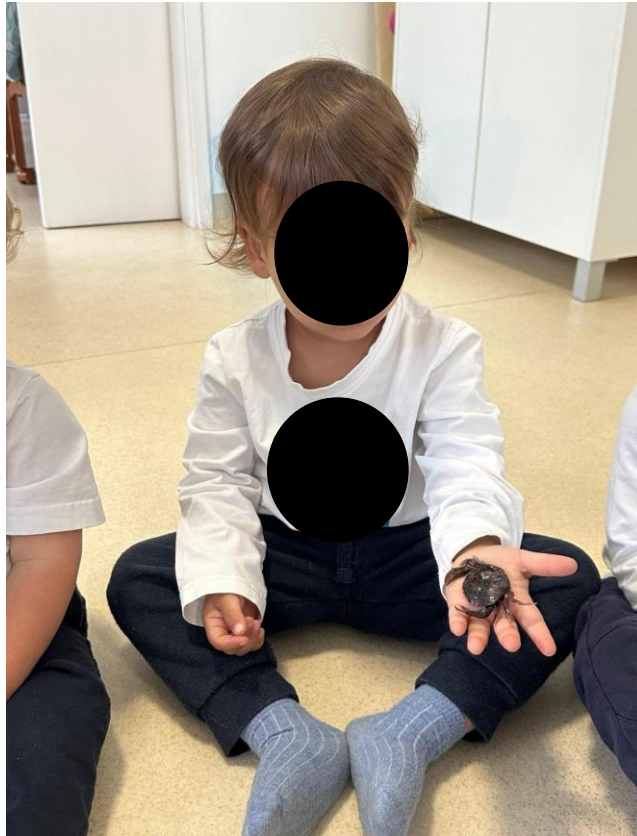
Imagem 16 - Exploração caranguejo

Também EB “reagiu positivamente e acompanhou com interesse a exploração”. Estes registos sugerem bem-estar e disponibilidade para se envolver quando os estímulos são apelativos e apresentados de forma acessível.