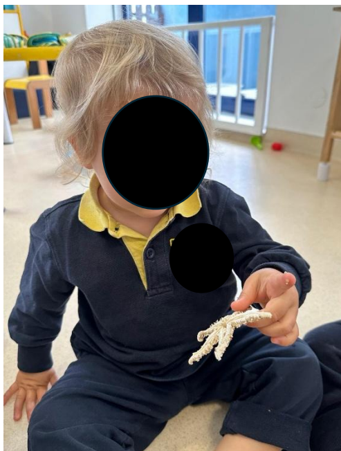
Imagem 19 - Exploração Estrela do Mar