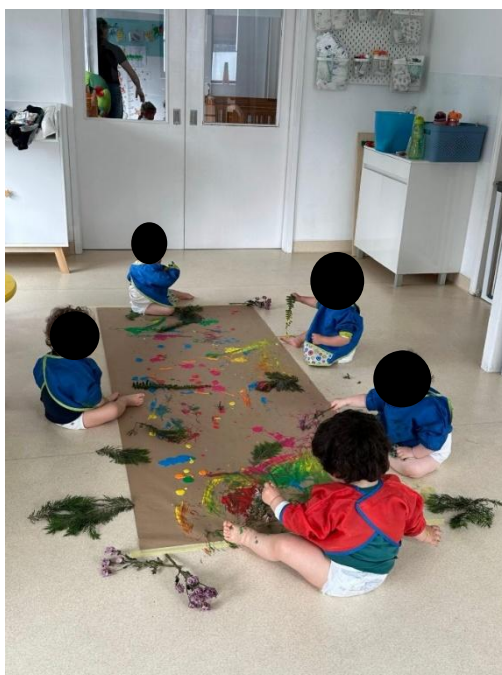
Imagem 10 - Pintura com plantas

Na dimensão cognitiva, a atividade favoreceu a observação, a experimentação e a procura de novas possibilidades. MN demonstrou curiosidade ao “experimentar diferentes plantas e repetir as suas descobertas”, e MG destacou-se por explorar “ao detalhe” e procurar “novas possibilidades na pintura”. Também SP fez comentários e perguntas simples sobre as plantas, mantendo-se atento ao processo. Estes exemplos ilustram como a ligação ao meio natural pode potenciar exploração ativa, formulação de hipóteses simples e atenção ao efeito das ações (marca, textura, cor), sustentando aprendizagens construídas pela experiência (imagem 11: Pintura com plantas).