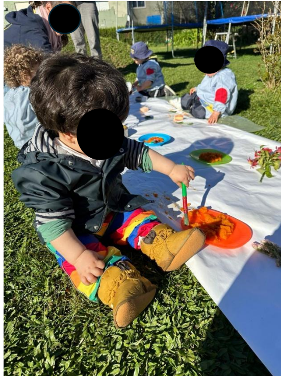
Imagem 3 - Pintura com alimentos