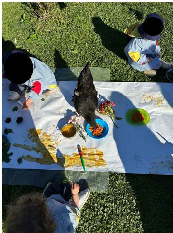
Imagem 2 - Pintura com alimentos

Ao nível cognitivo, a atividade favoreceu a curiosidade, a atenção e a iniciativa. A criança MA mostrou-se “muito atenta e observadora ao manipular folhas e paus”, o que evidencia exploração cuidada e foco na tarefa; SP “fez perguntas interessantes sobre o ambiente”, ilustrando curiosidade e procura de significado; e MG manifestou elevada curiosidade ao questionar sobre os insetos observados. Estes exemplos ajudam a concretizar o modo como a ligação ao meio natural pode ampliar a observação, a formulação de perguntas e a exploração sensorial como base para aprendizagens. A utilização dos materiais no momento de pintura, observável na Imagem 3 (Pintura com alimentos), ajuda a concretizar a passagem da exploração para a ação intencional (usar o material para produzir marcas/efeitos).