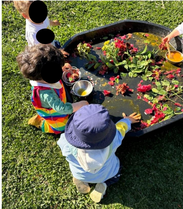
Imagem 21 - Exploração livre

Também AA “mostrou alegria e espontaneidade, envolvendo-se na cozinha de lama com entusiasmo”. Estes exemplos ilustram como a experiência ao ar livre, com materiais naturais e liberdade de exploração, favorece o bem-estar e a expressão de emoções positivas, contribuindo para um clima de segurança e curiosidade.