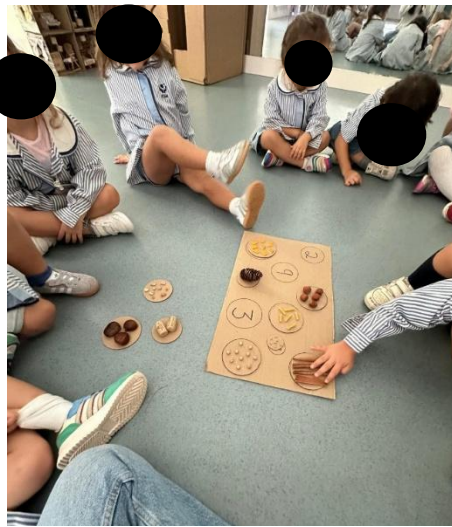
Imagem 31 - Participação no jogo