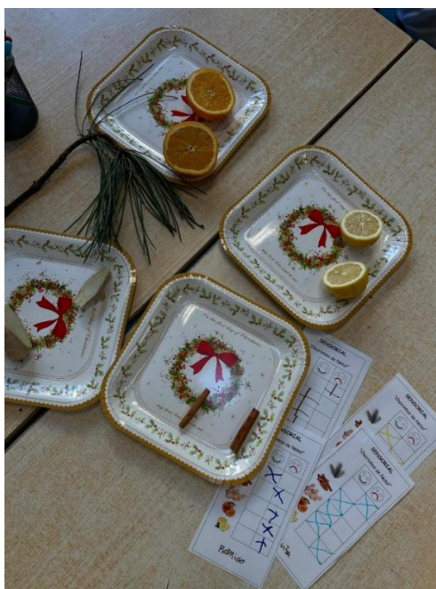
Imagem 32 - Sensorial – “Cheirinhos de Natal”

A Atividade 9, “Sensorial ‘cheirinhos de natal’”, consistiu numa proposta de exploração olfativa com diferentes aromas, permitindo às crianças cheirar, reagir, comentar e comparar sensações. Embora realizada em contexto de sala, esta experiência aproxima as crianças do meio natural através de estímulos sensoriais concretos e promove uma aprendizagem pela vivência direta. Assim, a atividade possibilita observar benefícios emocionais (incluindo autorregulação), sociais e cognitivos, bem como refletir sobre estratégias pedagógicas assentes na curiosidade e na exploração ativa, com mediação do adulto sempre que necessário. A organização dos frascos/aromas e o enquadramento inicial da experiência pode ser observado na Imagem 32 (Sensorial – “Cheirinhos de Natal”), que ajuda a visualizar a proposta sensorial.