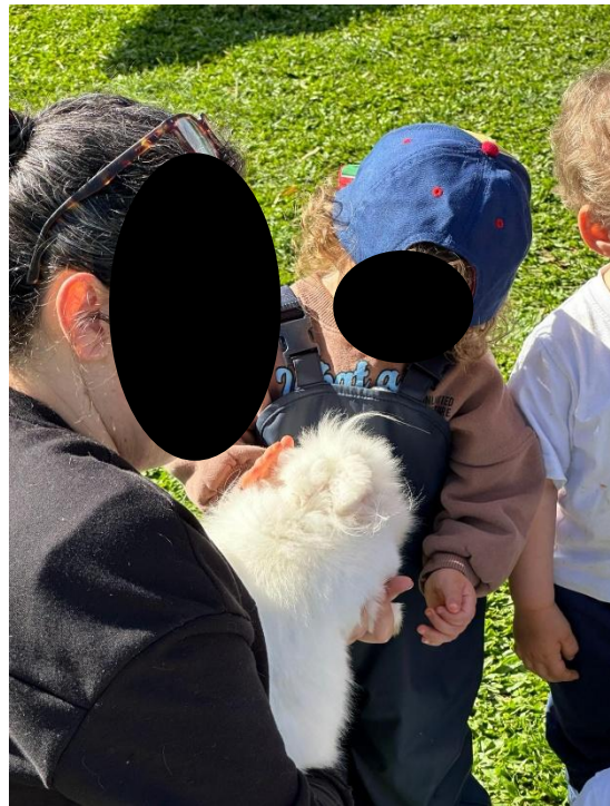
Imagem 24 - Contacto com os animais

Em conjunto com a exploração livre (Imagem 21) e a cozinha de lama (Imagens 20 e 22), estes momentos mostram uma experiência rica, onde a aprendizagem surge de forma natural a partir da ação e da relação com o meio.