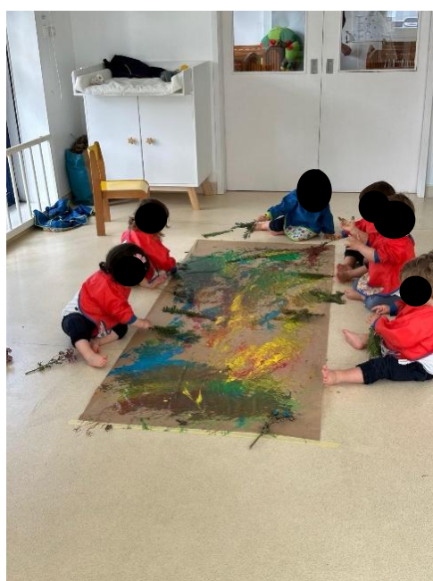
Imagem 11 - Pintura com plantas

Na dimensão cognitiva, a atividade favoreceu a observação, a experimentação e a procura de novas possibilidades. MN demonstrou curiosidade ao “experimentar diferentes plantas e repetir as suas descobertas”, e MG destacou-se por explorar “ao detalhe” e procurar “novas possibilidades na pintura”. Também SP fez comentários e perguntas simples sobre as plantas, mantendo-se atento ao processo. Estes exemplos ilustram como a ligação ao meio natural pode potenciar exploração ativa, formulação de hipóteses simples e atenção ao efeito das ações (marca, textura, cor), sustentando aprendizagens construídas pela experiência (imagem 11: Pintura com plantas).