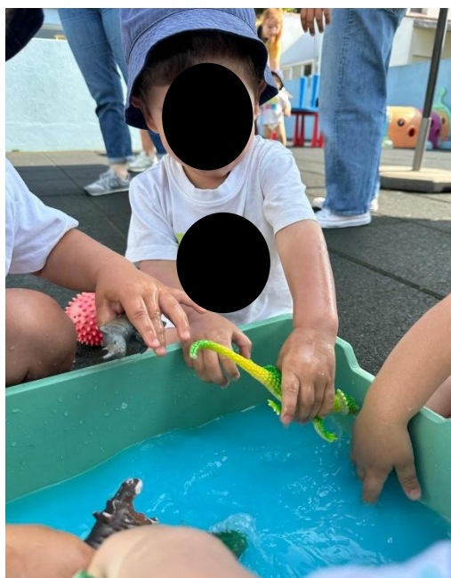
Imagem 27 - À descoberta dos animais

Relativamente à autorregulação, esta atividade é particularmente rica porque integra vários desafios: esperar a vez, manter-se focado, lidar com frustrações e pedir ajuda de forma adequada. Por exemplo, GB é descrito como revelando “bom autocontrolo nas atividades ao ar livre”, evidenciando capacidade de gerir o comportamento e manter-se regulado num contexto estimulante. Em contraste, AC é referido como tendo “tendência a procurar ajuda facilmente”, o que pode significar menor persistência autónoma ou necessidade de segurança/validação do adulto, sendo um ponto importante para orientar a intervenção pedagógica (apoiar, mas também incentivar pequenas tentativas antes de intervir). Também JM “ainda precisa de apoio em momentos de frustração”, o que reforça a importância de estratégias de mediação: verbalização de emoções, antecipação do que pode acontecer e encorajamento para continuar. A continuidade da procura e a exploração manual no recipiente são visíveis na Imagem 27 (À descoberta dos animais), mostrando como a tarefa exigiu envolvimento corporal e concentração.