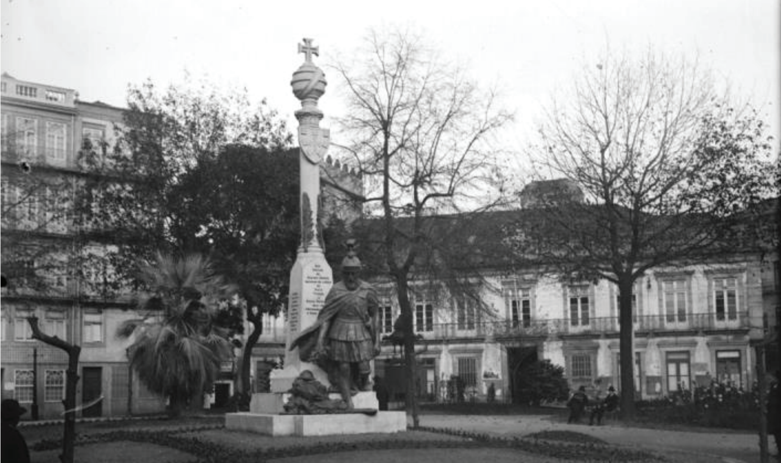
FIG. N.º 3 – MONUMENTO AO SOLDADO (PRAÇA CARLOS ALBERTO, PORTO), DA AUTORIA DE JOSÉ DE OLIVEIRA FERREIRA, 1924. CPF.

de erigir edifícios e monumentos condignos e apropriados ao fim que têm em vista, para que é ir lançar primeiras pedras nos pontos mais importantes da cidade?» (DCD, sessão 23.1.1925).