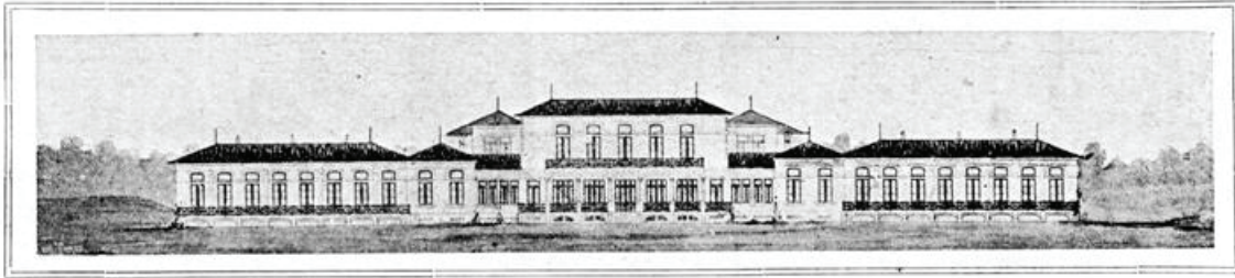
FACHADA POSTERIOR (VOLTADA AO MAR)

« Aquelle que podendo socorrer o proximo em perigo de succumbir, o não faz, é responsavel pela sua morte. »